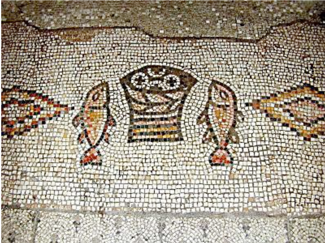
Pains et poissons d'une mosaïque de Tabgha.

Parmi les monuments qui nous sont parvenus, le poisson est souvent associé au pain et au vin comme en témoigne l'images ci-dessus. Saint Augustin (354-430) est le premier écrivain ecclésiastique à avoir donné une valeur eucharistique au poisson (voir son Traité sur l'Évangile de Jean , vers 416). De plus, une inscription conservée au Musée du Vatican présente le poisson-Christ comme l'aliment du banquet eucharistique. Mais c'est une exception car le symbole est habituellement associé au pain et au vin qui sont devenus, à la fin du IIe siècle, les seuls symboles de l'eucharistie.